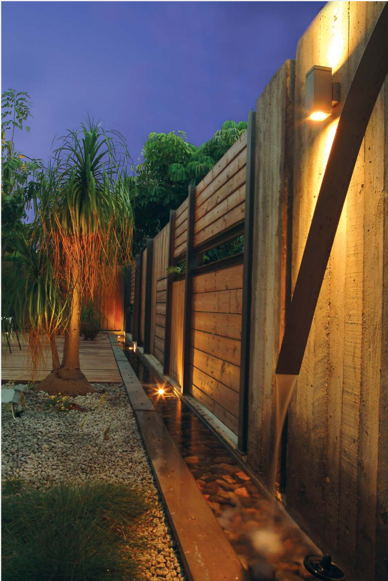
קסם לעת ערב בגינה האחורית