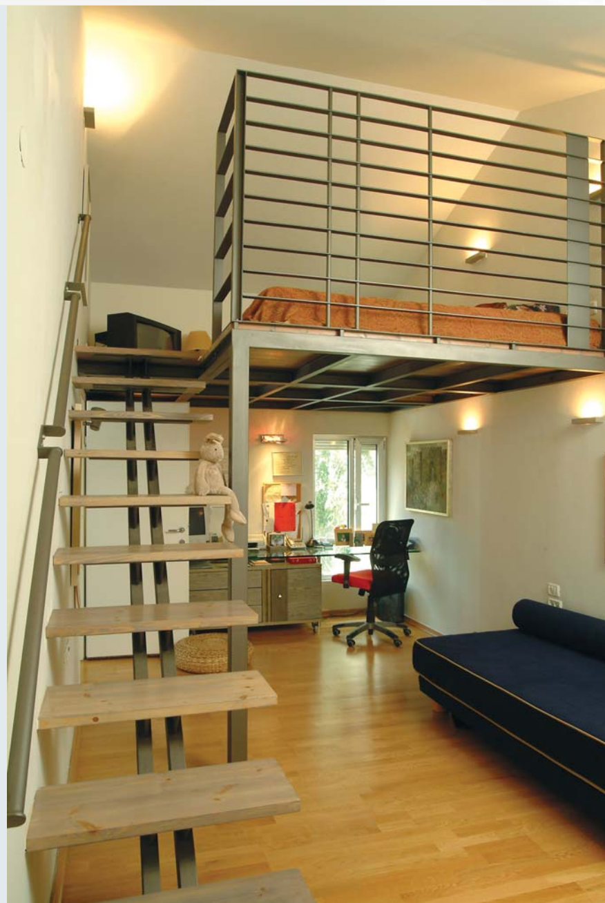
חדר העבודה/אירוח שזכה לתוספת גובה עם התקנת גג רעפים חדש. הגובה שנוצר נוצל לבניית גלריית שינה שנבנתה באמצעות קונסטרוקציית מתכת ומדרגות המובילות אליה. תחתית הקונסטרוקציה יוצרת הנמכת תקרה מעל פינת העבודה ומוסיף נופך חמים.

טרם התכנן החדש נחלק חלל הקומה השנייה לשלושה חדרים, שהיו סדורים לאורכו של מסדרון תחום במעקה ופתוח חלקית כלפי חלל המגורים שבקומה הראשונה. בארגון המחודש נותר אחד מהם כשהיה, ויתרת השטח הפכה לחלל אחד מרווח במיוחד, שבתוכו נטמע גם מרבית שטחו של המסדרון. המעקה שהוסר הומר בקיר מסך שקוף המשתרע לכל גובהו של החלל, וקטע קטן במקום המפגש עם גרם המדרגות נותר לשמש כמעין מעבר בין החדרים ונקודת תצפית פתוחה אל חלל המגורים. נכון לעכשיו הותקן בו מעקה מתכת מעוצב, אך במידת הצורך בעתיד ניתן יהיה להתקין במקום מעלית. למרות שמדובר בשני חללים "תקניים", מוגדרים ומצוידים כדלתות, ההיררכיה ביניהם מיטשטשת והזרימה היא חופשית וישירה, כמו מרחב אחד הנחלק לאזורים: אזור/חדר עבודה ואזור/חדר שינה.