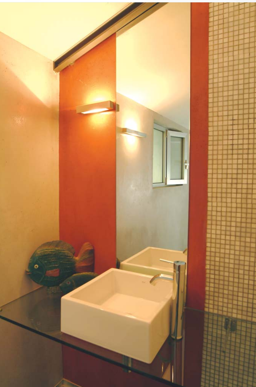
חדר הרחצה הצמוד לחדר העבודה: משטח כיור מזכוכית, חיפוי קיר מפסיפס, מראה מאורכת ונגיעה של גון אדום על לצדה.